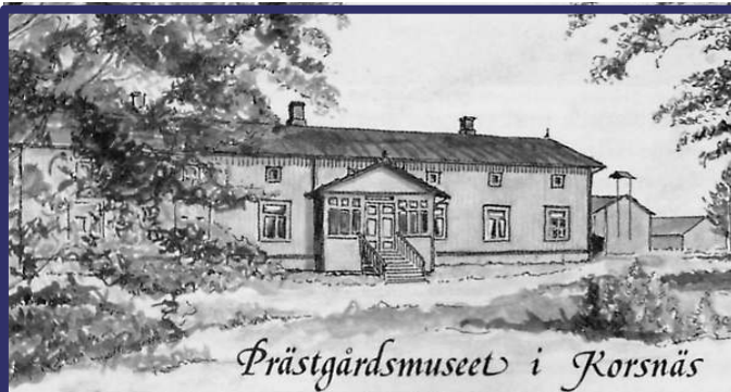
Prästgårdsmuseet i Korsnäs