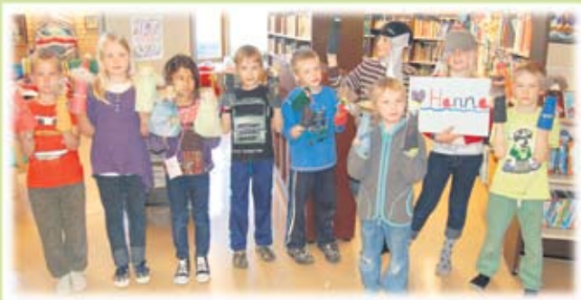
Arr. Korsnäs kommun - Fritid i samarbete med Korsnäs Hembygdsgörelse r.f

Anmälan senast 15.6 till helena@sou.fi eller 050-5910049