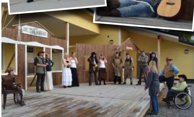
Fartfylld can-can utlovas!