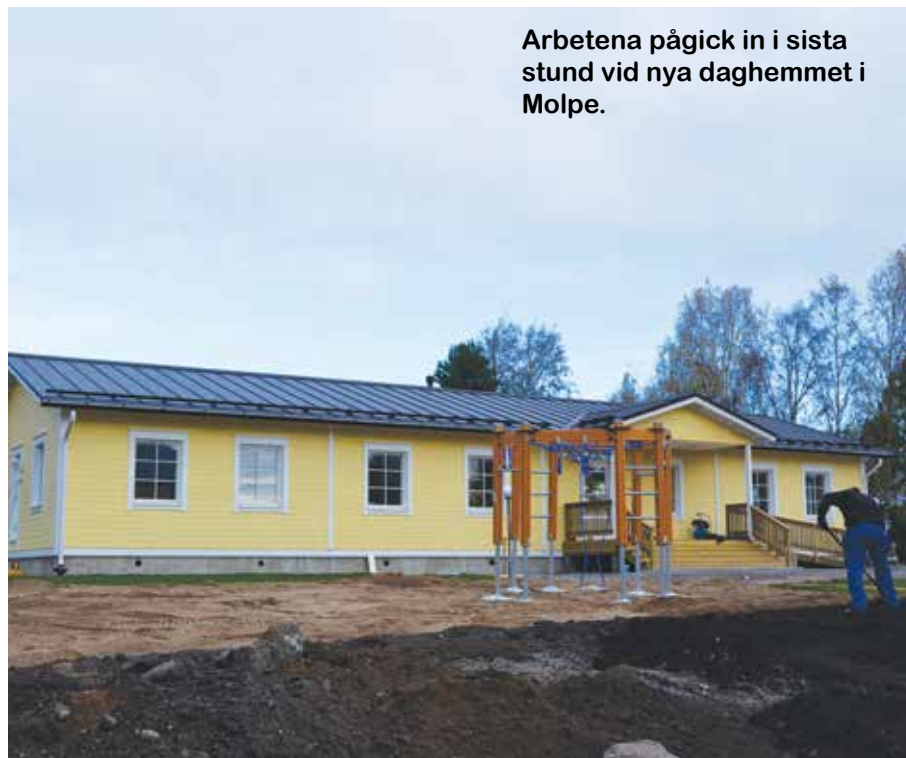
Arbetena pågick in i sista stund vid nya daghemmet i Molpe.