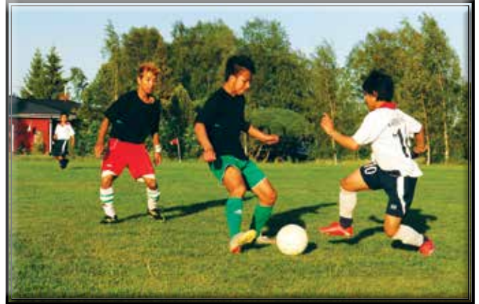
Fotbollsspelande Karennilaget från Korsnäs och Malax.