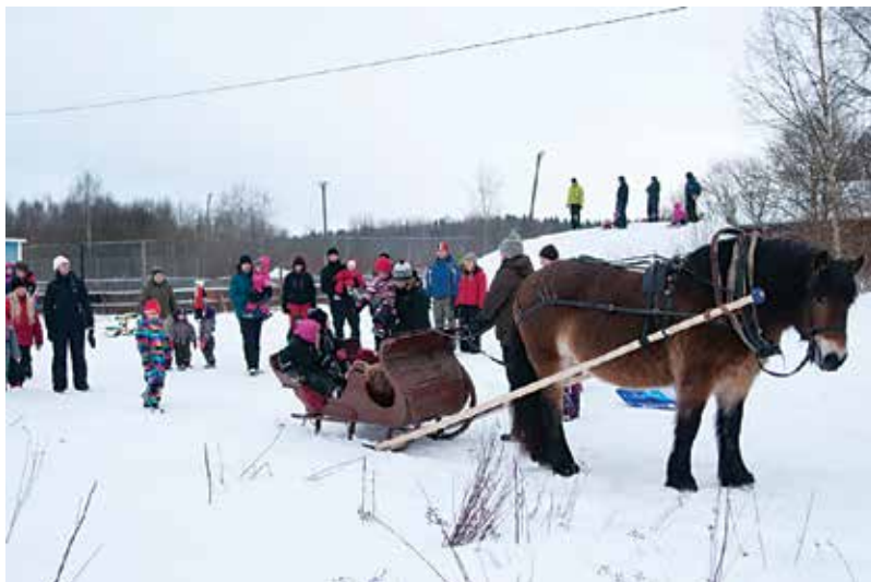
På fastlagsjippet 10.2.2013 bjöds barnen på skjuts med häst och släde.

Pulkorna var det populäraste fortskaffningsmedlet på fastlagsjippet.