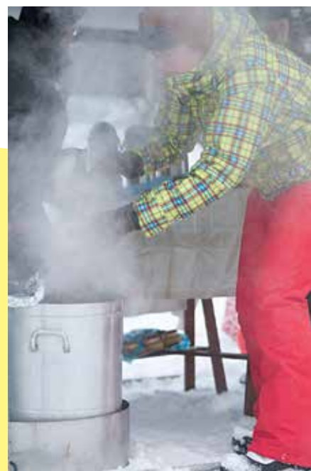
Gott med värmande ärtsoppa mellan aktiviteterna.