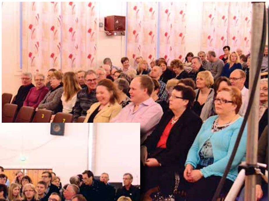
Glada miner bland publiken på pjäsen "Ett riktigt fynd" i Taklax uf.