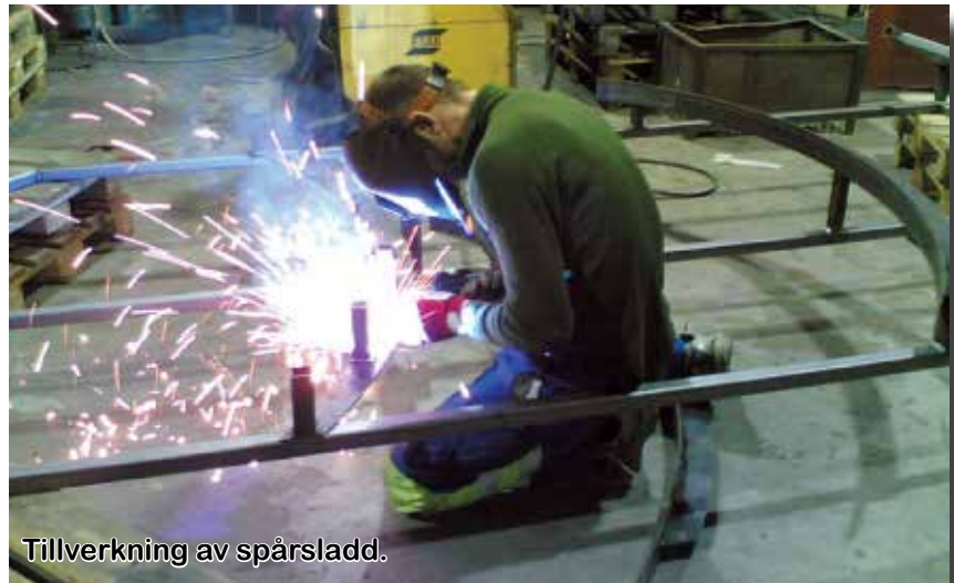
Tillverkning av spårsladd.

Tekniska nämnden beslutade 26.2.2013 att ge ett bidrag för materialkostnaden till spårsladden om 706,15 euro.