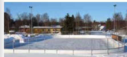
Rinken i kyrkbyn.

Tekniska nämnden beslutade 26.2.2013 att anta Aluetekniikka Oy:s offert om 7.500 euro moms 0% för planering av alla tre rinkarna. Aluetekniikka Oy har gett den billigaste offerten.