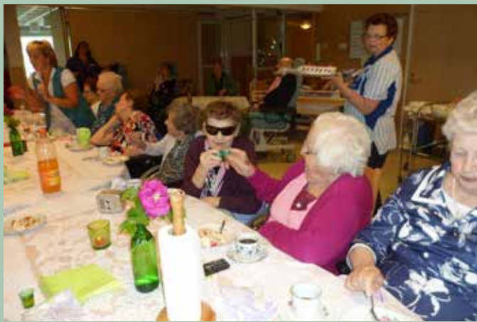
Midsommarfest vid festdukat bord.