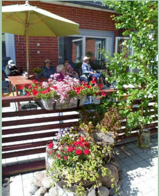
Sång och kaffestunder i Sinnenas Trädgård.