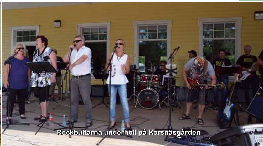
Rockbultarna underhöll på Korsnäsgården