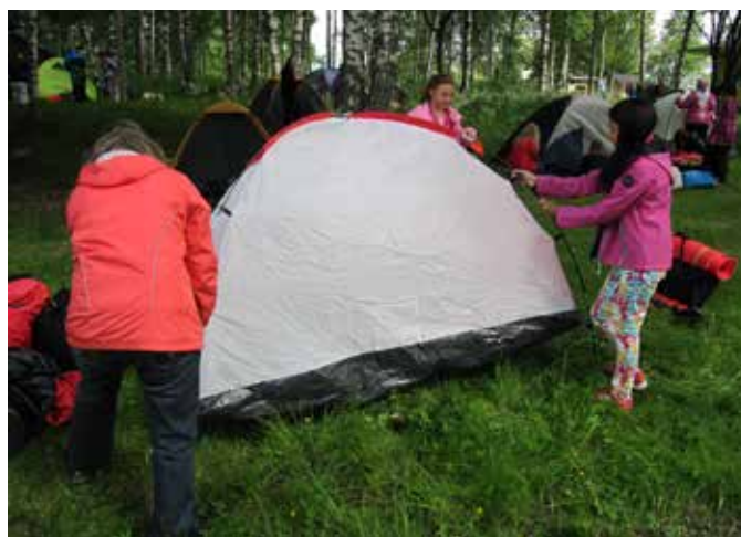
Tältuppsättningen har börjat.