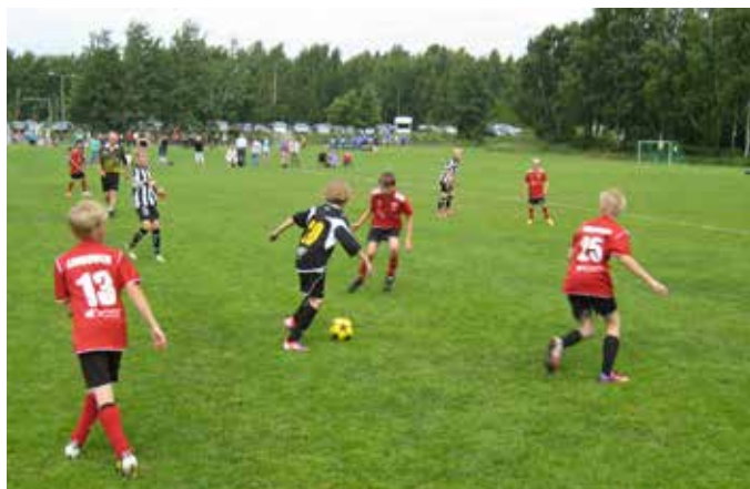
Korsnäs FF-juniorer möter VPS-j under Wasa Footballcup.

Korsnäs FF P12 gjorde även de bra ifrån sig och placerade sig på 12 plats bland 18 lag. Korsnäs FF:s juniorlag deltar även i juniorcupen och de äldre även i distriktsserien så det spelas många matcher under en säsong och man går framåt och blir bättre hela tiden.