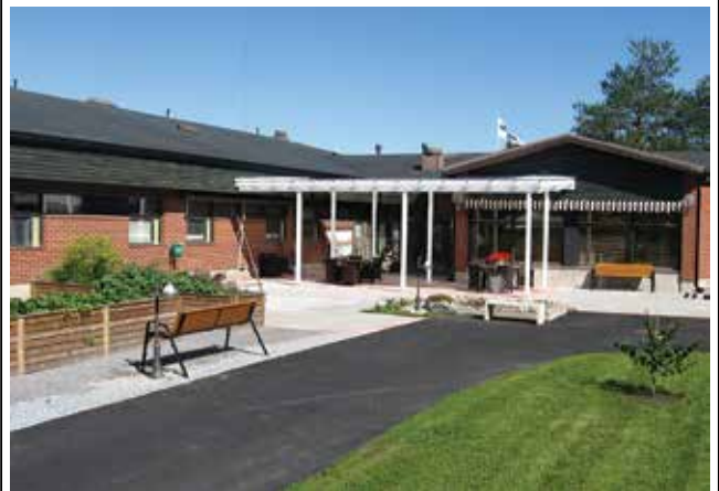
Arbetsgruppen för Sinnenas trädgård

Välkommen på invigning av Sinnenas trädgård vid Malax-Korsnäs HVC fredagen den 6.9.2013 kl. 14-16.