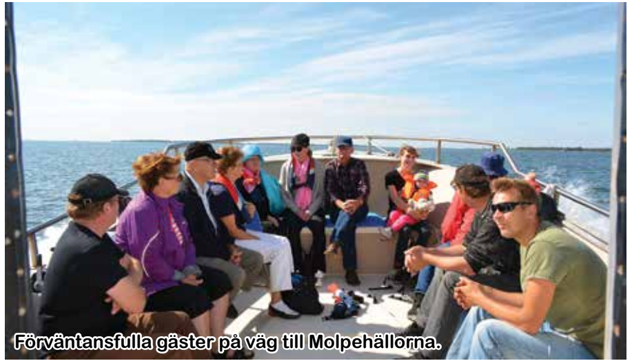
Förväntansfulla gäster på väg till Molpehällorna.