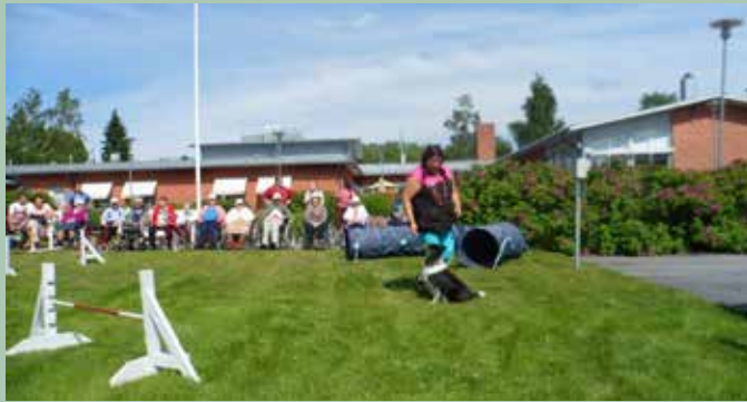
Agility - en njutbar stund på gräsmattan.