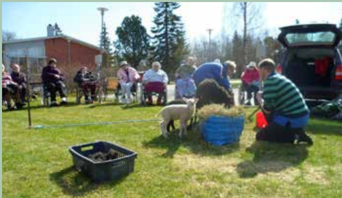
Fårklipping - en upplevelse från gamla tider.