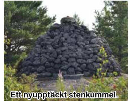
Ett nyupptäckt stenkummel.

I år har Forststyrelsen låtit röja och dra en ny sträckning för naturstigen vid Vippfyren högre upp på land för att undvika den sankt sjöbotten, längs vilken den ursprungliga stigen gick. Samtidigt har man då upptäckt ett gammalt stenkummel uppe på Mittihällorna, som förmodligen fungerat som sjömärke en gång i tiden, men som numera befinner sig högt uppe på land osynligt från sjösi-