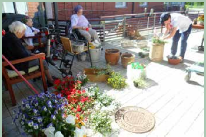
Plantering av sommarblommor, som vi kan njuta av på våra terrasser.