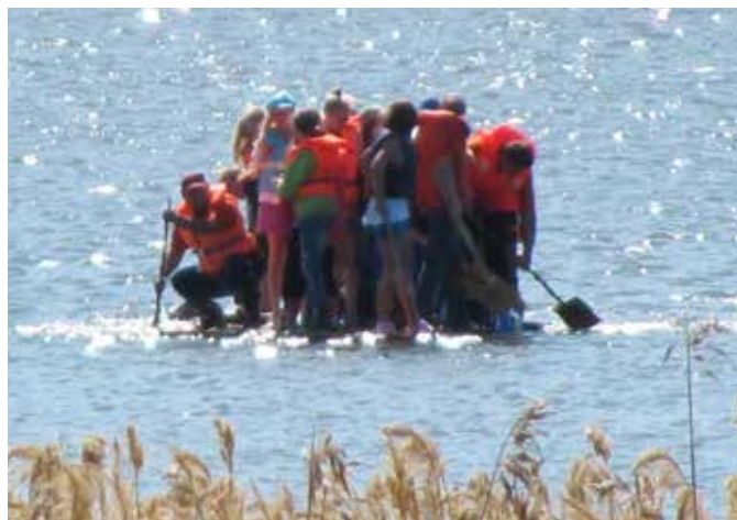
Flottbyggarna ute på en provtur.