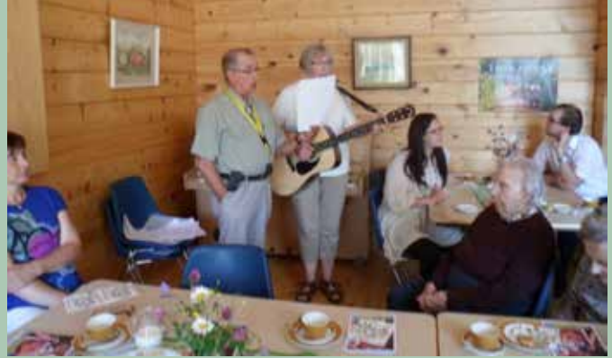
Kaffe och sång på Strandhyddan med Korsnäs församling.