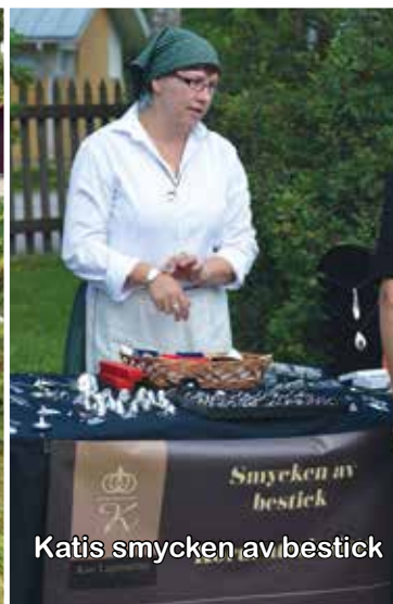
Katis smycken av bestick