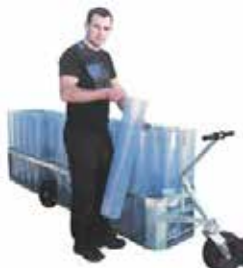
THYRESTRUP MINK rövagn

Välkommen att besöka vår monter på riksskinnutställningen!