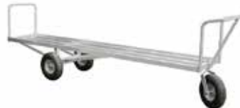
FARMVAGNAR - tre eller fyra hjul

Välkommen att besöka vår monter på riksskinnutställningen!