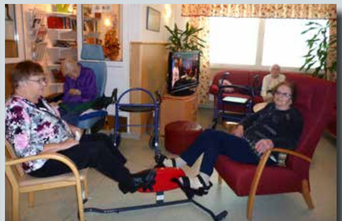
Motion och aktivering med träningsredskapet Actileg som Korsnäs Röda Kors-förening donerat.