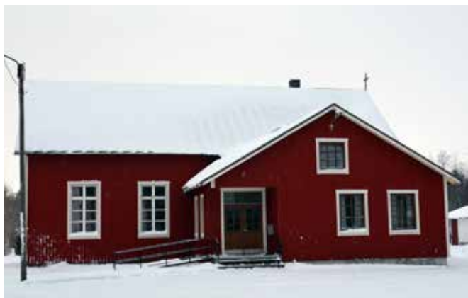
Molpe bykyrka har fått tilläggsisolering, ny brädfodring och restaurerade fönster.

- Köp gärna biljett på förhand. De säljs i byns butiker och servicepunkter, informerar arrangörerna.