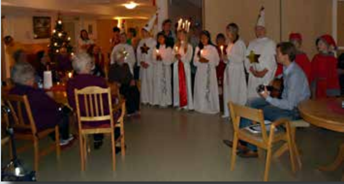
12.12 Korsnäs lågstadieskolas Lucia på besök.

Bildcollage över aktiviteter på Lärknäs i december 2014.