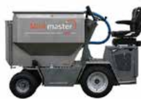
MAACH TECHNIC fodertruckar

Frillmossavägen 2 | 66900 Nykarleby | Tel. 06 781 7450 Strandvägen 4131 | 62200 Korsnäs | Tel. 06 282 7700