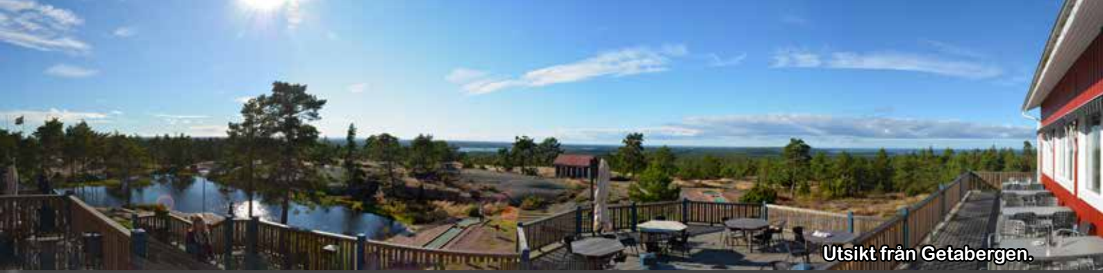
Utsikt från Getabergen.

efterrätt, men de hungrigaste valde att satsa på Skördefestmenyn, ett smörgåsbord bestående av 50 olika rätter.