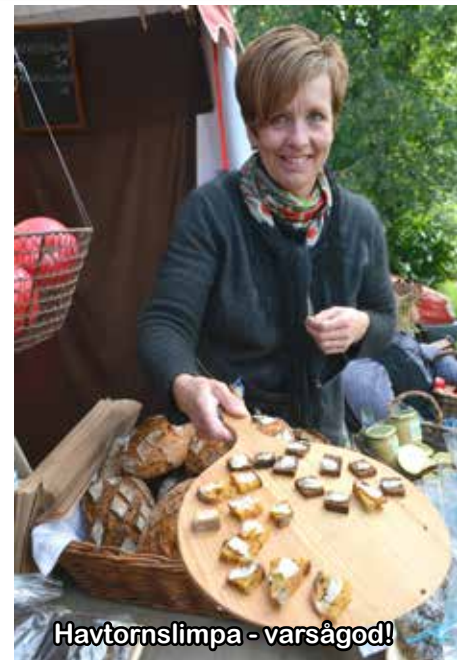
Havtornslimpa - varsågod!