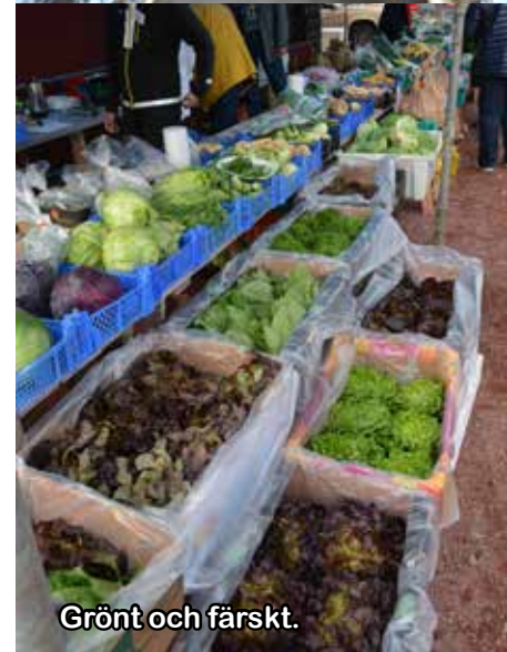
Grönt och färskt.