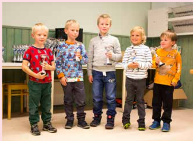
Pojkarna under 7 år har fått sina pokaler.