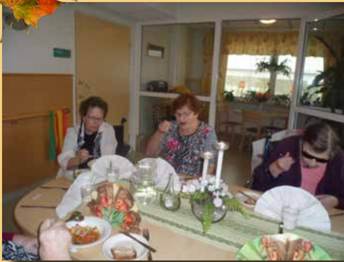
Höstdukning. Vi äter en god höstsoppa.