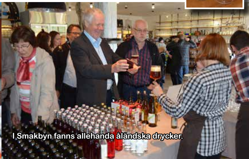
I Smakbyn fanns allehanda åländska drycker.