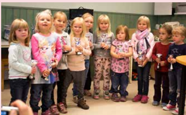
Glada pristagare i den yngsta klassen för flickor.