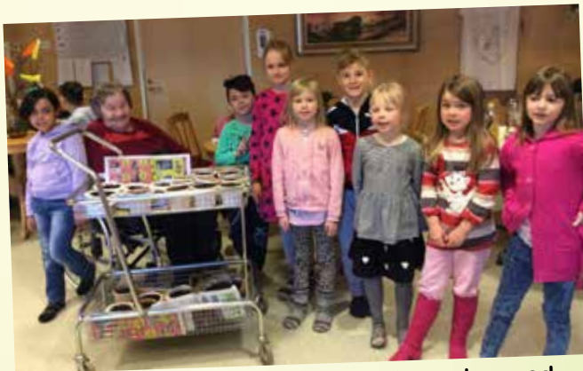
Förskolan från Korsnäs tillbringade en dag med våra äldre.