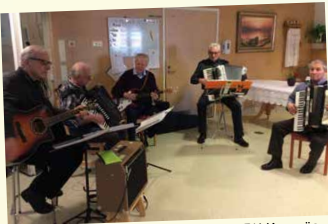
Vändagsfest. Musik av Korsdraget. FRK Korsnäs avd. bjöd på tårta, det tackar vi för.