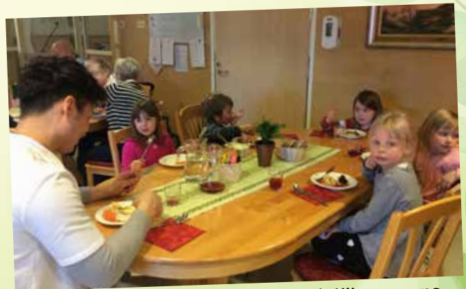
Vi påskpysslade, sjöng och åt lunch tillsammans. Uppskattningen och glädjen var stor.