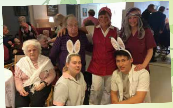
Påskhäxor och harar på besök.