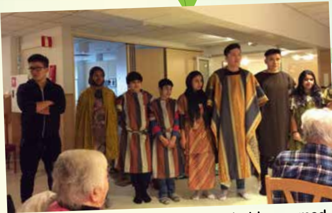
Asylsökande ungdomar kom och glädde oss med sång, musik o teater.