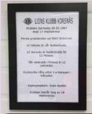
Grundinfo om Lions Klubb Korsnäs.

Fakta om klubben och lionsverksamheten samt klubbens klippböcker visades upp. Vernissage med kaffe och dopp hölls fredagen den 3 mars.