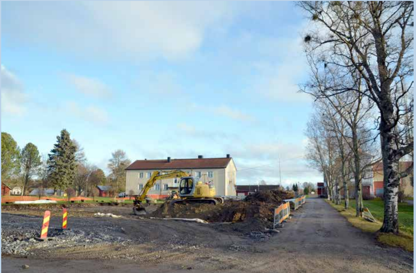
Uusi pysäköintialue rakennetaan ja ulkoalueet laajennetaan Korsnäsän kirkonkylän koululla.