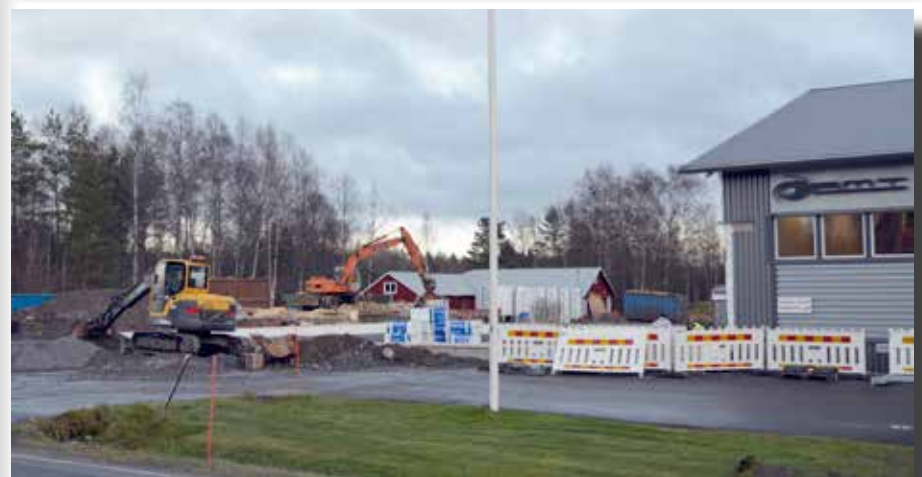
Tillbyggnaden vid MrMotors är i full gång.