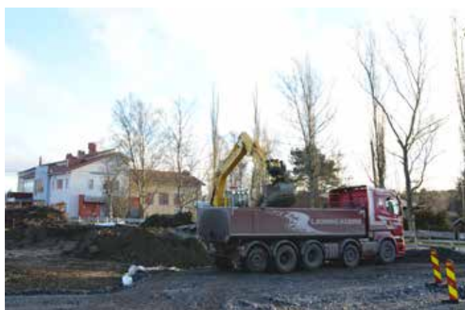
Arbetet inleddes i början av november.