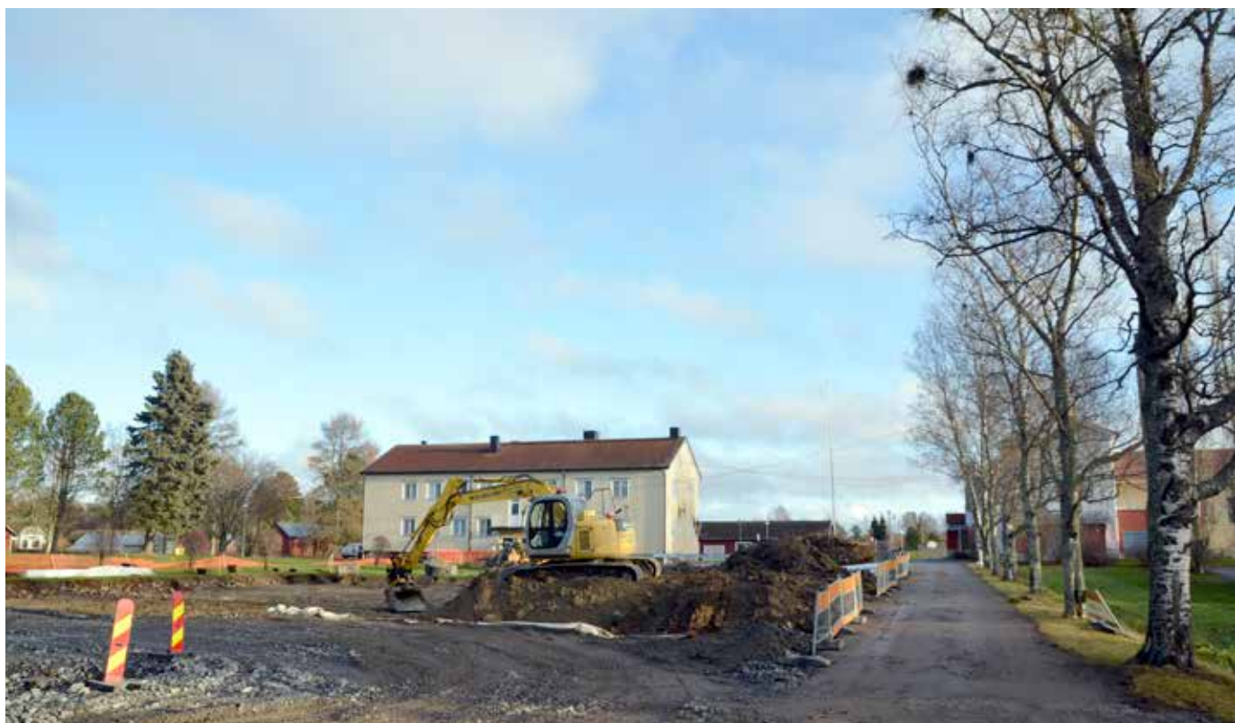
Tryggare uteområden och ny parkeringsplats anläggs vid Korsnäs kyrkoby skola.