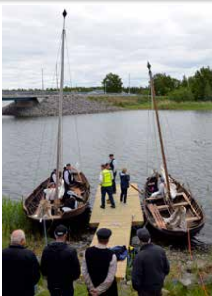
”Smugglarna” från Molpe gör sig redo för start.