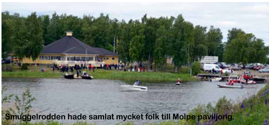
Smuggelrodden hade samlat mycket folk till Molpe paviljong.