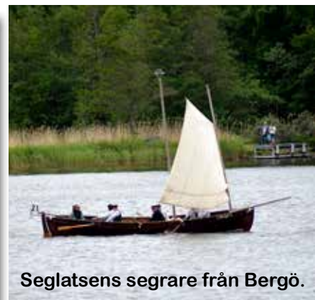
Seglatsens segrare från Bergö.

Lördagen den 8 juni var det premiär för Smuggelroddin i Molpe. Tio båtar från regionen deltog i den första seglatsen.