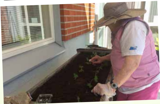
Vi planterar utomhus både morsdagsrosor och jordgubbar mm.