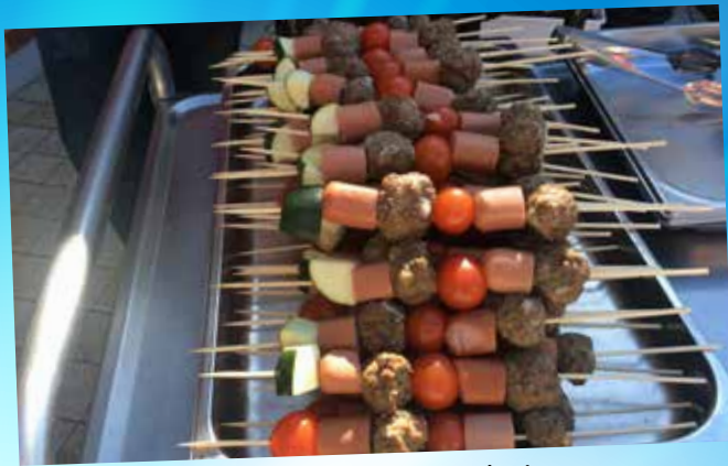
Vi grillar ute och njuter av majvädret.