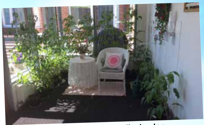
Vi odlar tomater, chili och paprika i aulan.