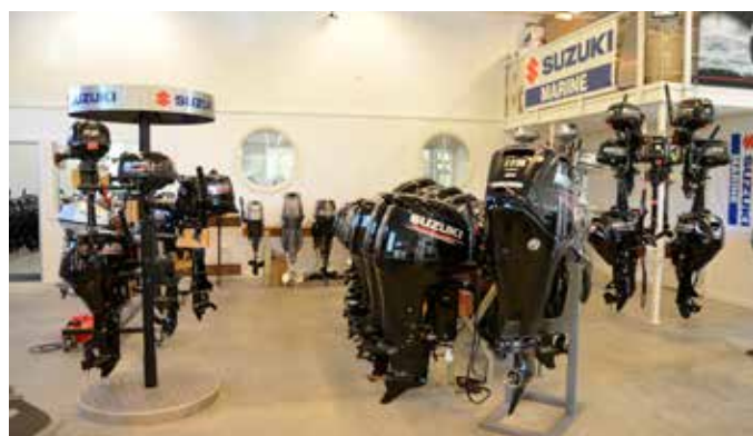
Båtmotorer i alla storlekar finns utställda i butiken.