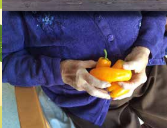
Skörd av vinbär, morötter och paprikor.