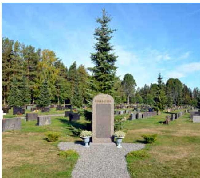
Minnes/urnelunden på Korsnäs begravningsplats.