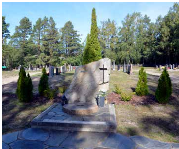
Minnes/urnelunden vid Molpe begravningsplats.