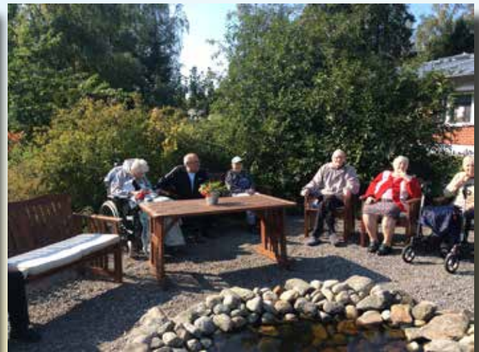
Vi grillar korv och äter utomhus, njuter av vädret.