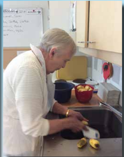
Vi odlar och tar upp potatis och på kvällen äter vi dem till middag!