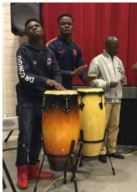
Asafa-gruppens taktfasta trummare.

Text och foto: Anita Ismark, ordförande för Korsnäsnejdens Pensionärer r.f.