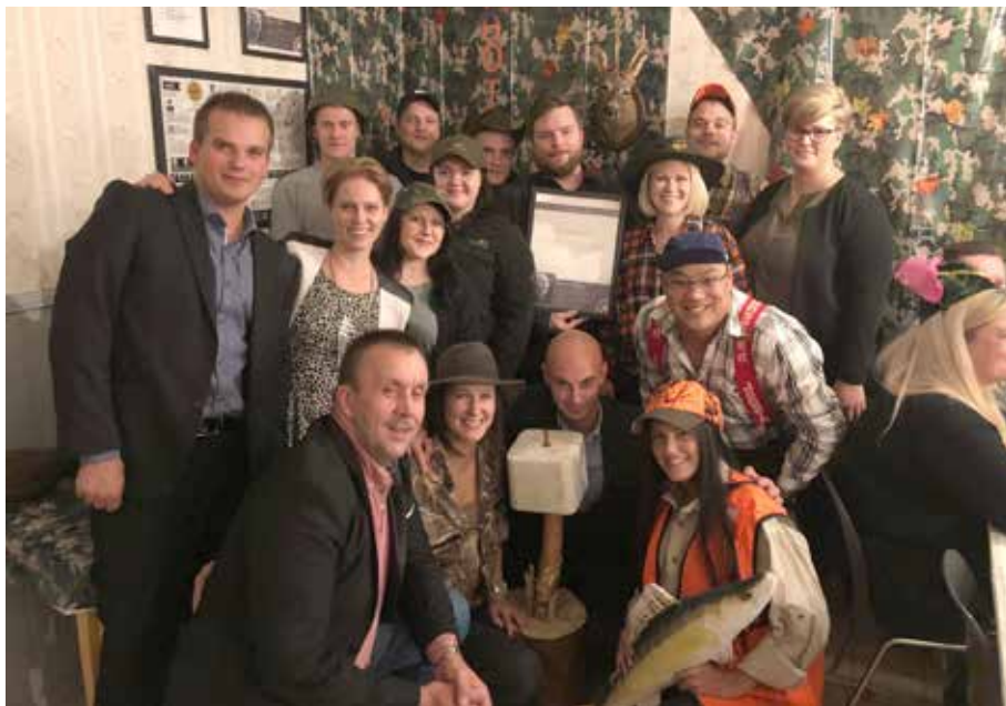
Medlemmar ur Molpe ufs styrelse och ungdomsutskott på Johannesgalan.