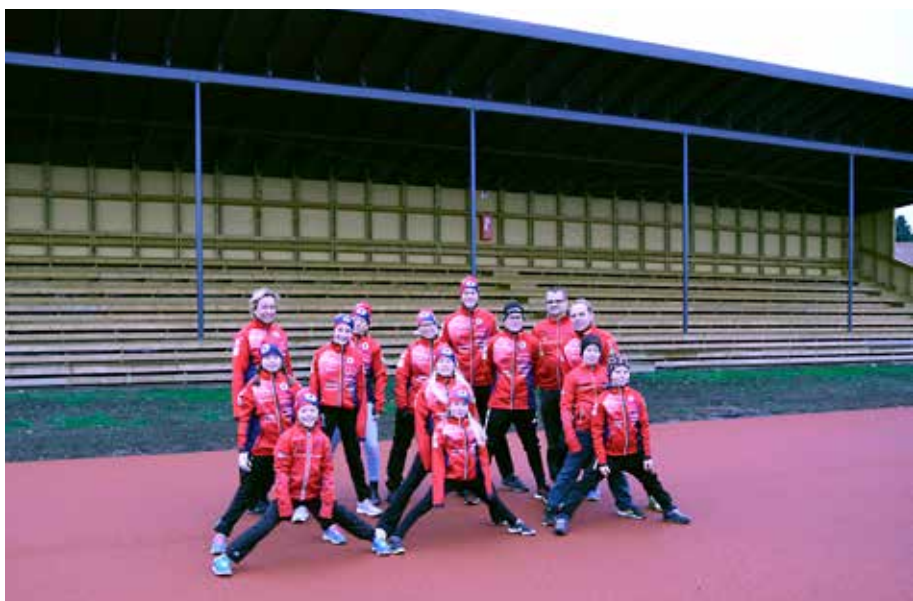
Fyrens juniorer värmer upp inför nästa sommars tävlingar.

I planeringen för upprustningen av centralidrottsplanen var det tänkt att asfalten skulle bibehållas vid längdhopp och området vid stav- och höjdhopp. Men underentreprenören som gör allvädersbeläggningen påpekade att asfalten var i ett sådant skick att allvädersbeläggningen inte kunde garanteras hålla. Den gamla asfalten togs bort och ny genomsläpplig asfalt lades på dessa områden. Dess-