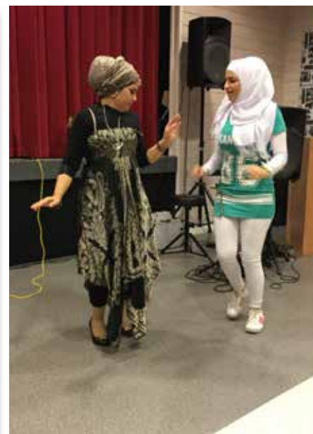
Spontan syrisk dans.