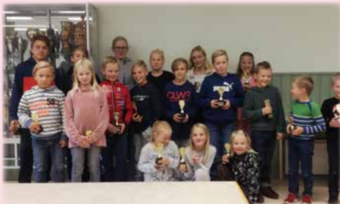
Årets pristagare på bild.