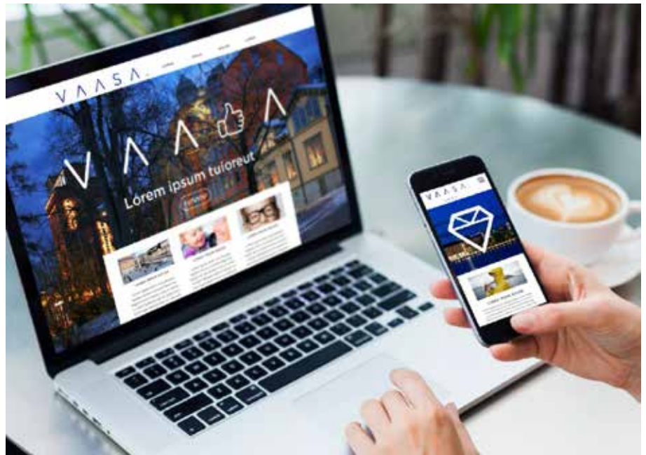
Ungefär så här kommer Vasaregionens nya webbtjänst att se ut.

Vaasa Parks Oy driver en webbtjänst vaasanseuduntoimitilat.fi över lediga företagslokaler och -tomter i Vasaregionen. Registret kan användas av alla kommuner i regionen och hittills har den finansierats i huvudsak av Vasa stad.