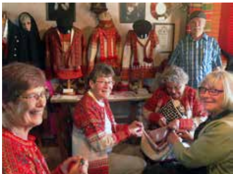
Nöjda hantverkare i hembygds-museet.

På hantverksdagen mötte ett hundratal besökare upp för att ta del av museets samlingar och följa med produktionen av en Korsnäströja.