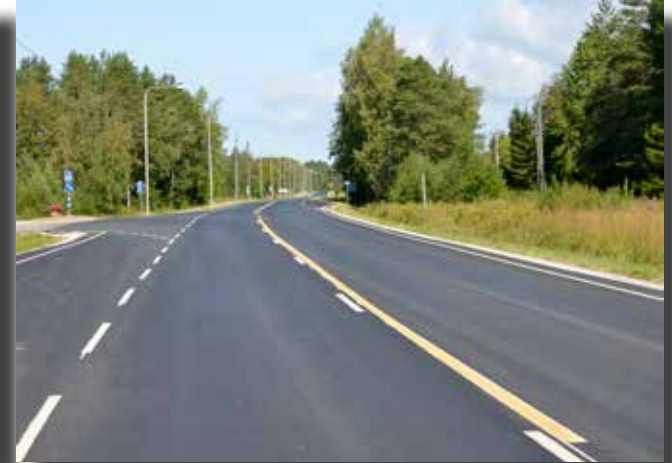
Ny asfalt och nymålade vägmarkering leder besökarna till Korsnäs kyrkby.