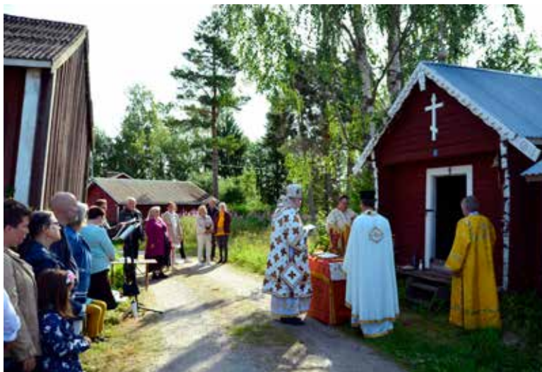
Liturgin genomfördes på Juthnystuvägen i Harrström, där den ortodoxa tsasounan finns.