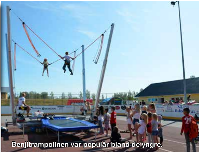
Benjitrampolinerna var populära bland de yngre.