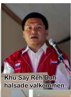
Khu Say Reh Duh hälsade välkommen.