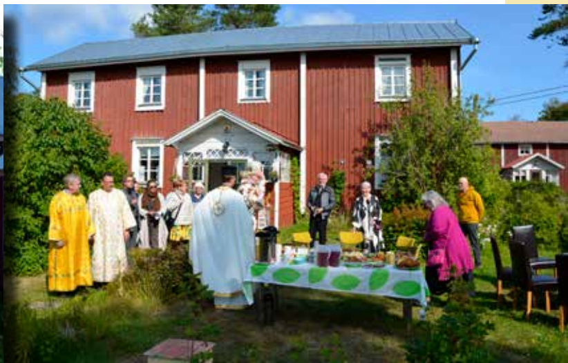
Innan kyrkkaffet fick avnjutas, måste bordets alla gåvor välsignas.