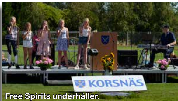
Free Spirits underhåller.