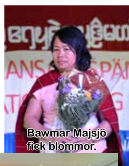
Bawmar Majsjö fick blommor.