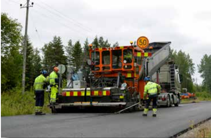
Asfalteringsarbetet gick smidigt med effektiva maskiner.

fick 500 000 euro av Trafikverket, vilket räckte till nio kilometer ny asfalt. Korsnäs kommun kunde med sitt anslag på 150.000 euro se till att ytterligare tre kilometer genom Korsnäs kyrkby till Södra Inderfjärdsvägen fick ny asfalt.