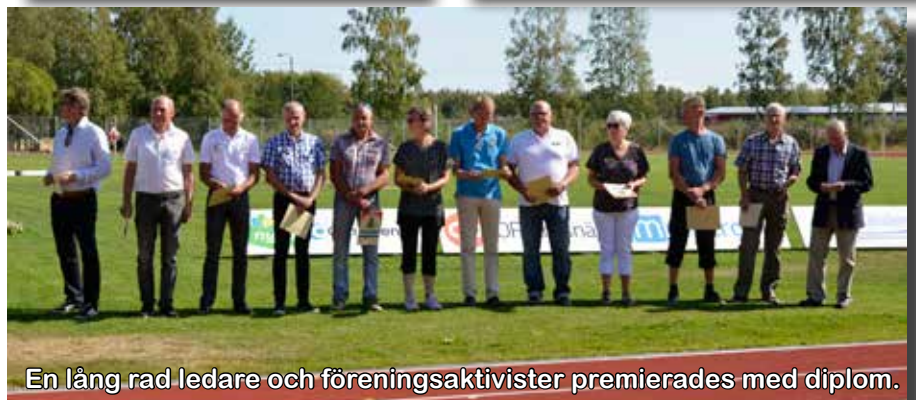
En lång rad ledare och föreningsaktivister premierades med diplom.