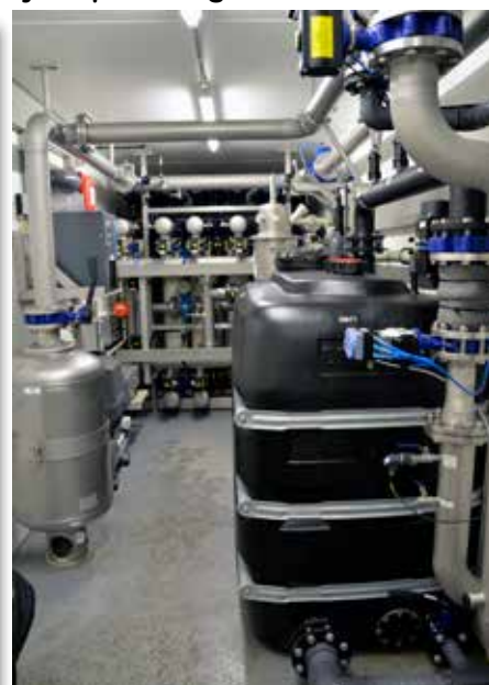
Reningsverket innehåller effektiva reningsfilter.