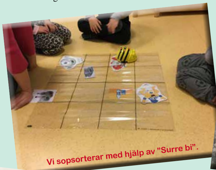
Vi sopsorterar med hjälp av "Surre bi".

Molpe daghem Tulavippan har under hösten satsat mycket på lek och utevistelse. Tärnan har haft "köket" som tema vilket också har märkts av i barnens lekar. Nu i jultider fick barnen på Måsen vara med och fundera på vilka ingredienser som behövs för att baka pepparkakor. Vid provsmakningen av barnens degförslag på pepparkakor märkte man att de smakade pizza-pepparkaka. Barnen kom då på en idé, att man kan följa ett pepparkaksrecept från en kokbok. Pepparkakorna bakades på dadelsocker och agavesirap – MUMS!