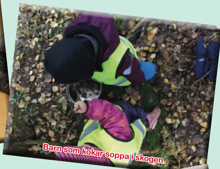
Barn som kokar soppa i skogen.