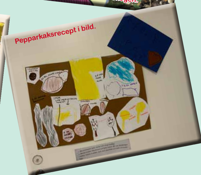
Pepparkaksrecept i bild.