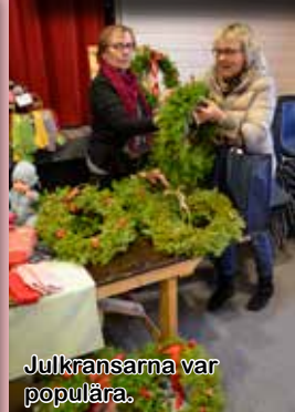
Julkransarna var populära.