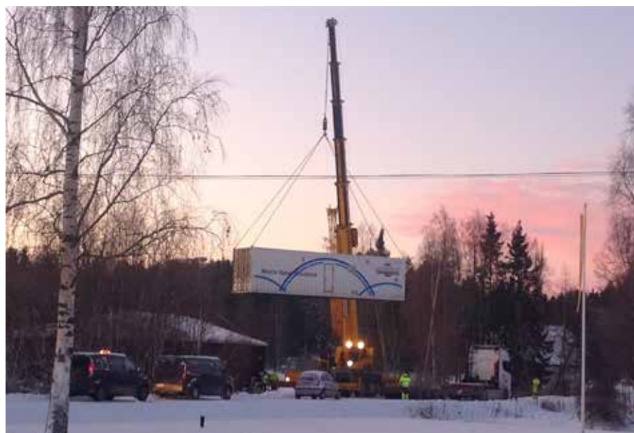
Vattenreningsverket lyftes på plats måndag morgon 11.11.2019.