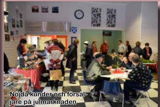
Nöjda kunder och försäljare på julmarknaden