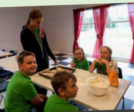
Deltagarna i Matskolan fick pröva på allt från bakning till matlagning och servering.