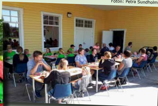
Familjemiddagen som avslutade Matskolan serverades ute på terrassen vid Korsnäsgråden pga pandemins restriktioner. Vädret var turligt nog på vår sida och gästerna verkade trivas.