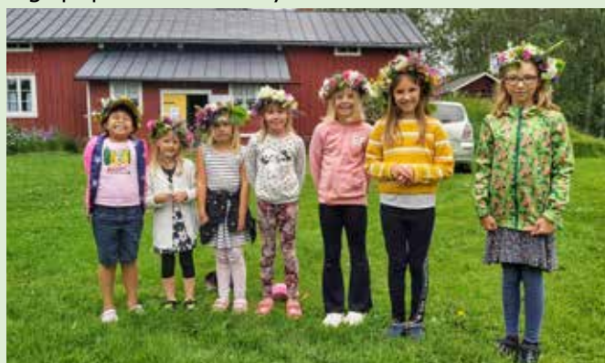
Ett gäng glada flickor poserar med sina fina midsommarkransar.