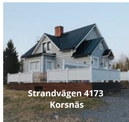
Strandvägen 4173 Korsnäs