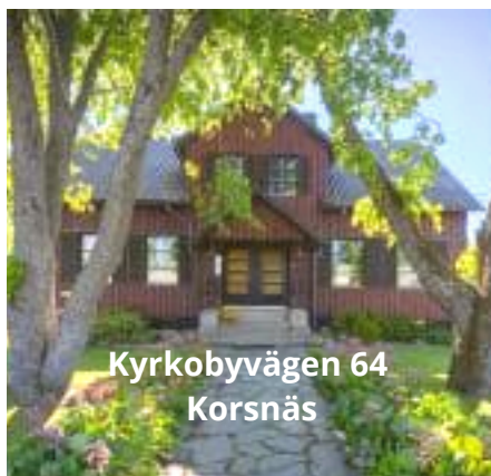
Kyrkobytvägen 64 Korsnäs