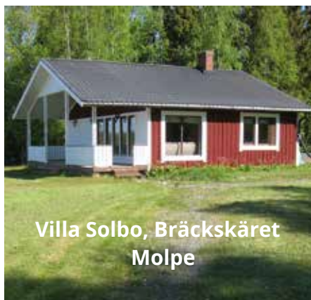
Villa Solbo, Bräckskäret Molpe

Information om privat försäljning och uthyrning av lediga hus hittas på: www.korsnas.fi > Boende och närmiljö > Privat försäljning och uthyrning