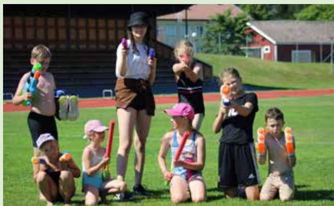
Vattenkrig var ett populärt evenemang som lockade hela 13 deltagare. Här syns en del av dem.